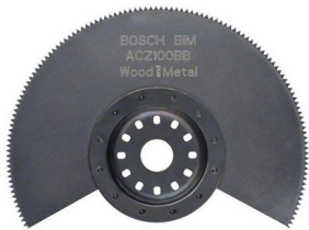
Lama segmentata BIM ACZ 100 BB per multi cutter