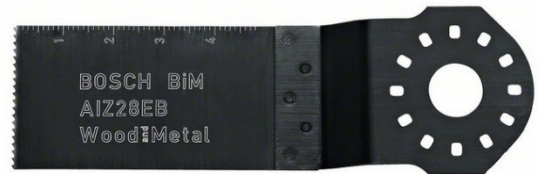
Lama per tagli dal pieno BIM AIZ 28 EB per multi cutter