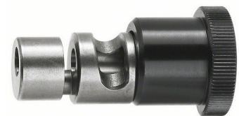
Matrici per lamiera piatta