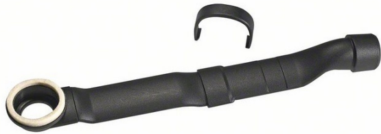
Aspirazione della polvere per MULTI CUTTER GOP 250 CE