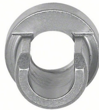
Matrici per lamiera ondulata