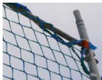
DETTAGLIO ANELLO DI AGGANCIO